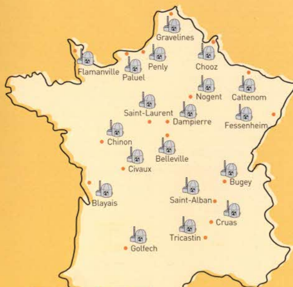
Localisation des 19 centrales nucléaires françaises

Les habitants et les établissements recevant du public (ERP) : écoles, commerces, entreprises, administrations, etc. des communes situées dans le rayon de 10 à 20 kilomètres autour des 19 centrales nucléaires françaises, soit environ 2 200 000 personnes, 204 400 ERP dont 1 800 écoles, répartis sur près de 1 100 communes et 33 départements.